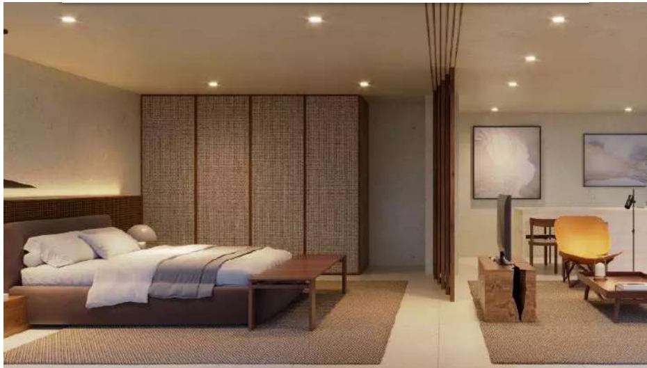
Os sócios também vão dispor de quartos e serviço de hotelaria no Beyond

A Klabin Segall "chegou a ser avaliada em R$ 1,7 bilhão", mas "depois da crise do Lehman Brothers o mercado derreteu" e Segall e os outros sócios passaram o controle para a Agra e a espanhola Veremonte, em 2009. Na época, a empresa acumulava dívida de R$ 637 milhões, sendo R$ 430 milhões em debêntures. As compradoras pagaram o equivalente a R$ 112,5 milhões, ou R$ 1,83 por ação.