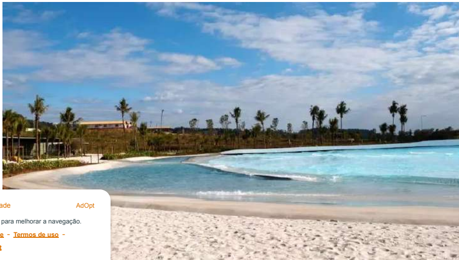
Itupeva com praia artificial e piscina com ondas

No início, não foi fácil convencer os investidores que seria rentável fazer a Praia da Grama, por exemplo. Foi por essa razão que a KSM assumiu como incorporadora as fases 3 e 4 da expansão do condomínio de Itupeva, em 2019. "Foi um investimento de R$ 400 milhões entre terreno, praia, infraestrutura da fase 3 e fizemos uma receita de R$ 750 milhões".