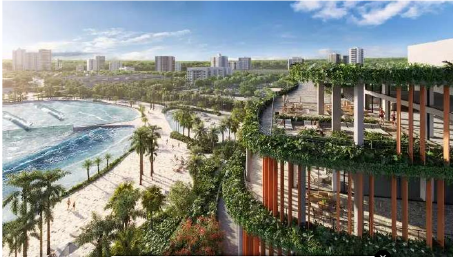
Os terraços com vista para a cidade

O Beyond de São Paulo com foram vendidos 530 deles explica Segall, poderá ser por exemplo.