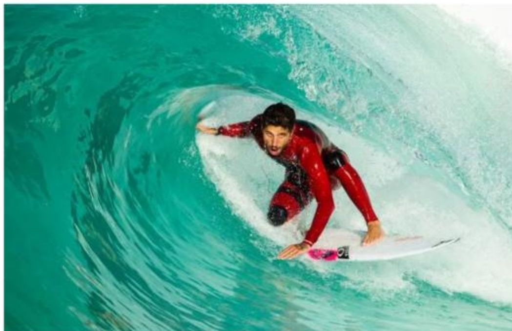
Filipe Toledo surfa em piscina Wavegarden.