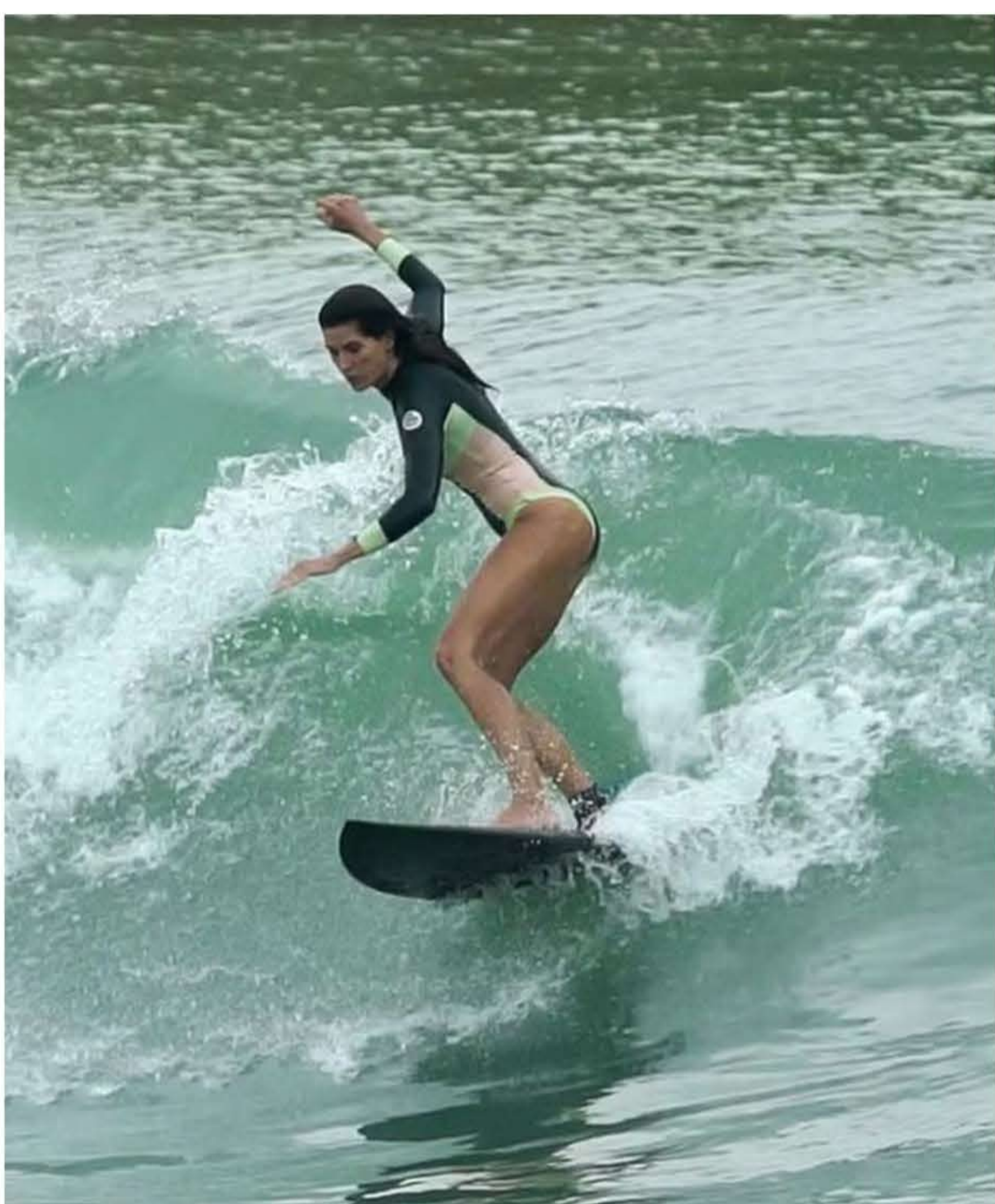
Mercado de ondas artificiais