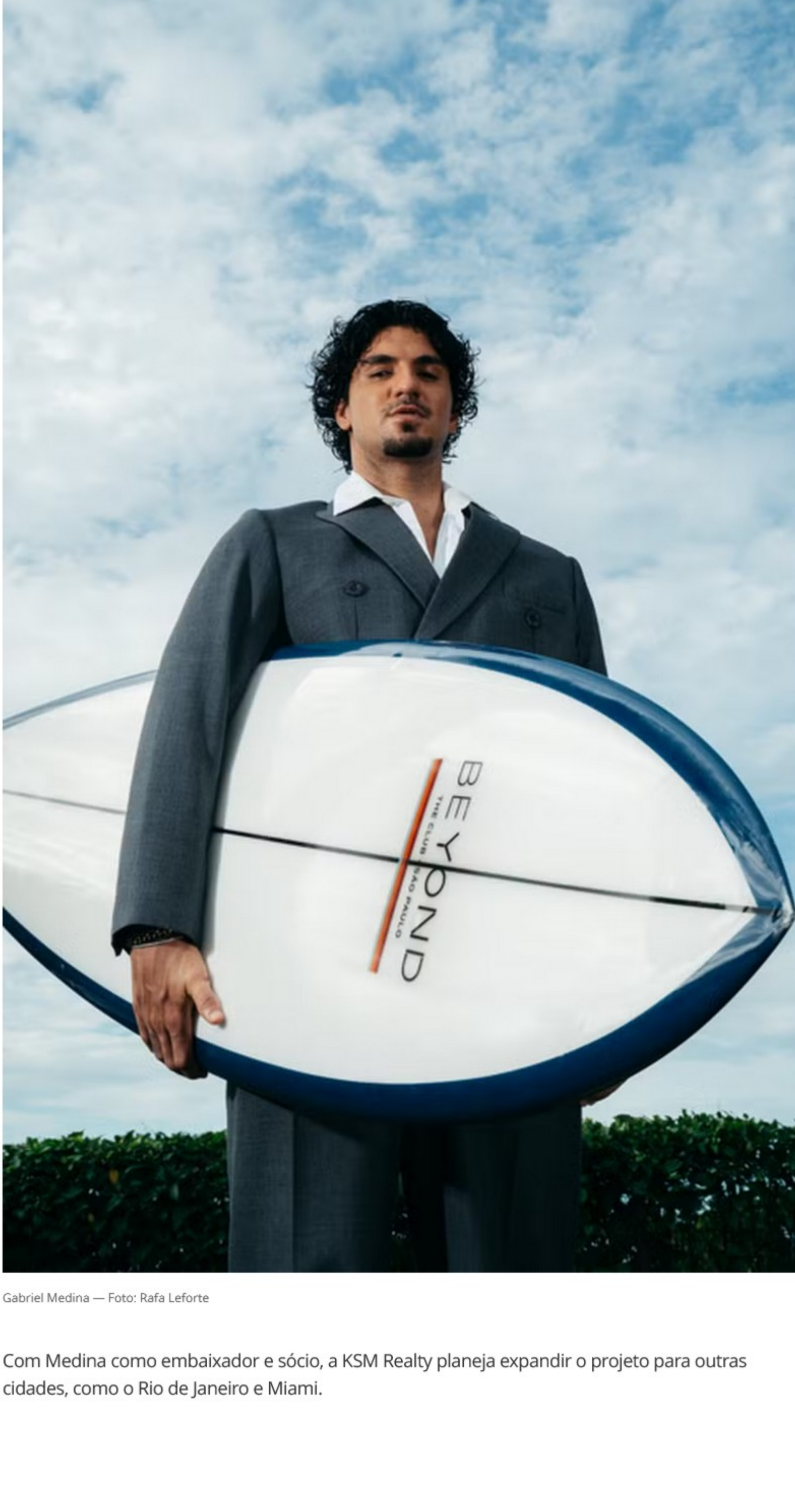
Gabriel Medina

- O Beyond The Club representa um novo capítulo na minha carreira, em que posso aplicar tudo o que aprendi no surfe, como disciplina, inovação e superação, para criar algo realmente transformador no setor imobiliário. Piscinas de onda como essa são uma revolução para o surfe, e estou empolgado com a possibilidade de explorar novas frentes e conectar as pessoas a um novo estilo de vida - disse Medina.