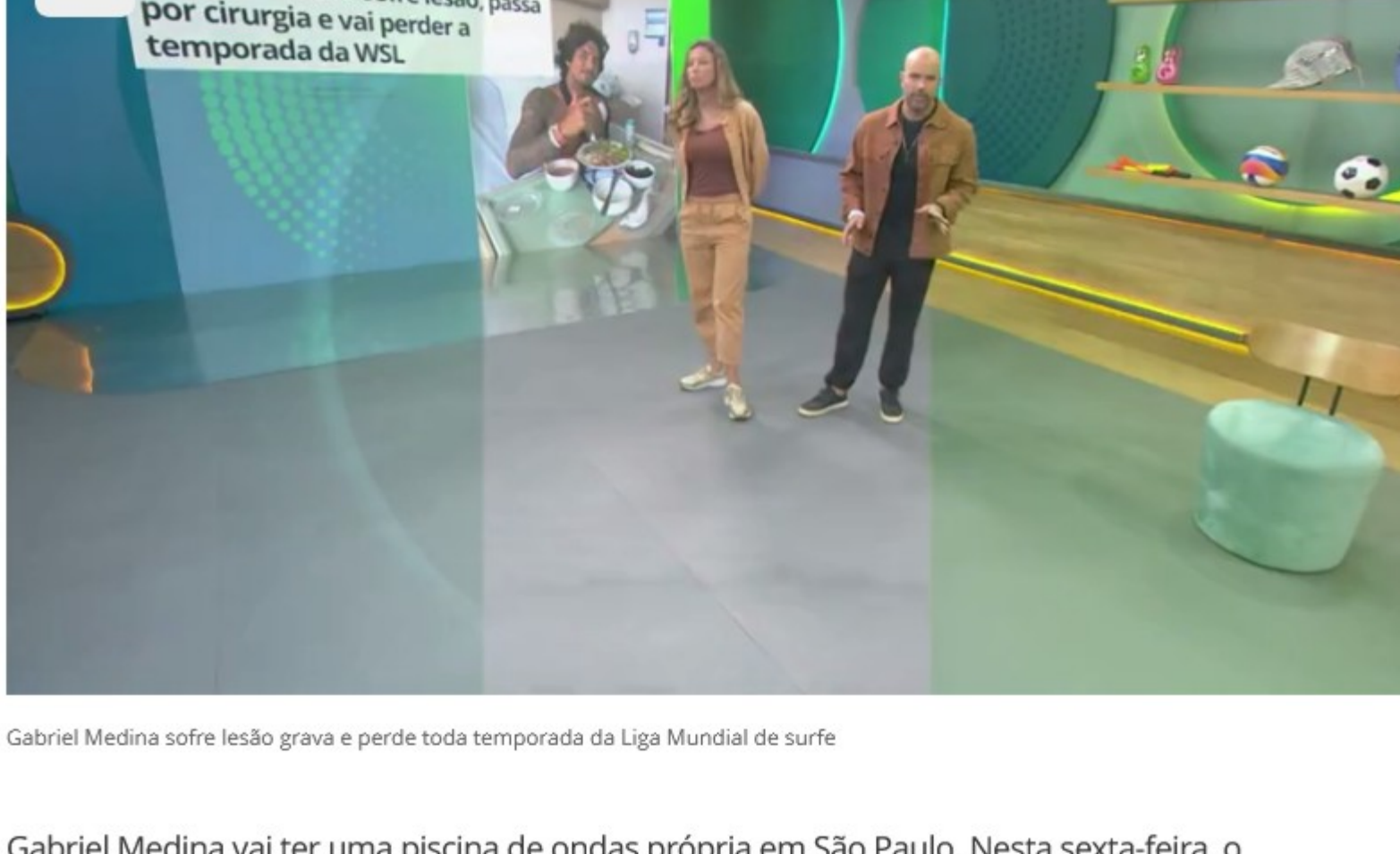
Gabriel Medina sofre lesão grave e perde toda temporada da Liga Mundial de surfe

Gabriel Medina vai ter uma piscina de ondas própria em São Paulo. Nesta sexta-feira, o tricampeão mundial do surfe anunciou investimento no setor imobiliário, tornando-se sócio da incorporadora KSM Realty no empreendimento Beyond The Club . O clube de luxo em Santo Amaro, zona sul da capital paulista, tem lançamento previsto para abril e tem como principal atração uma praia artificial de 28 mil m².