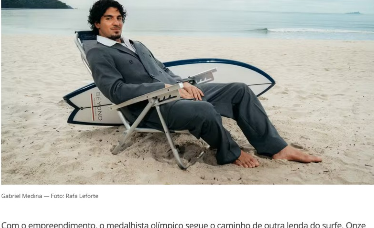
Gabriel Medina

+ Gabriel Medina sofre lesão, passa por cirurgia e vai perder a temporada da WSL