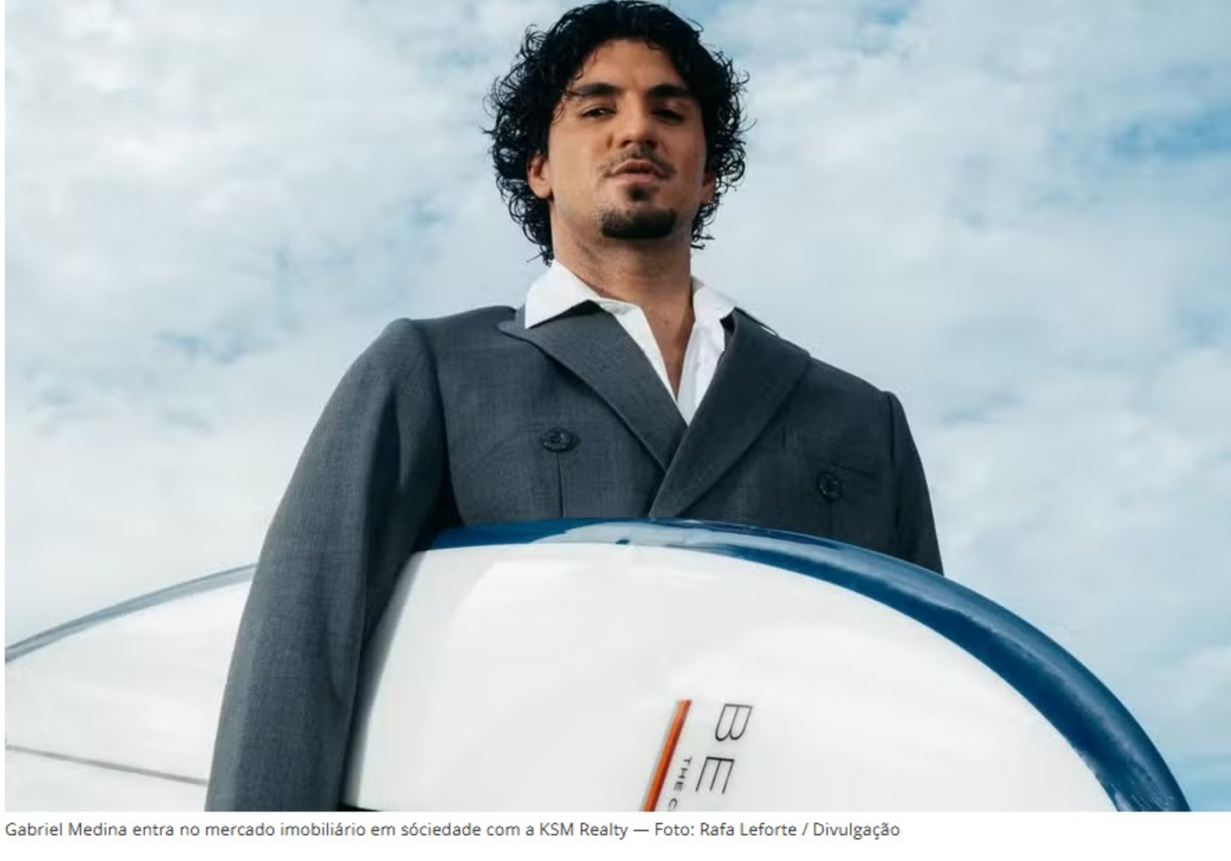
Gabriel Medina entra no mercado imobiliário em sociedade com a KSM Realty